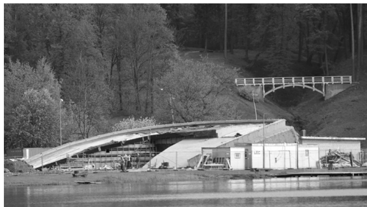
Multifunkcionālās servisa ēkas apveids jau ir redzams