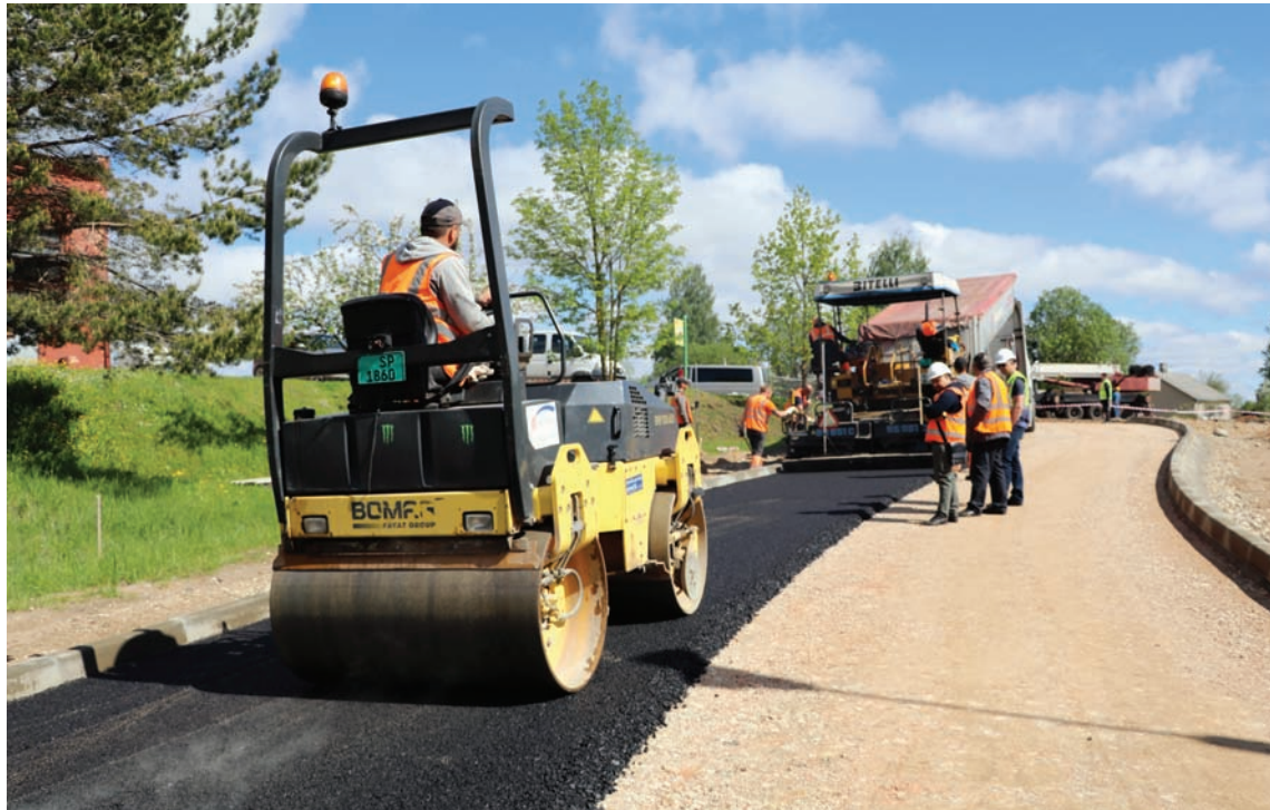
Asfaltēšanas darbi šonedēļ Ganību ielā

Rīgas ielā kopš darbu uzsākšanas šī gada aprīļa beigās jau ir paveikta virkne darbu. Uzbūvēta zemes klātne trotuāram un velosolīņam no Rūpniecības līdz Krišjāņa Barona ielai. Plānots, ka šīs nedēļas nogalē, ja būs labvēlīgi laika apstākļi, varēs sākt apmaļu būvniecību. Brauktuves daļā nofrezēts vecais segums, uzklāta asfalta izlīdzinošā kārtā un asfaltseguma apakškārtā. Izrakti grāvji, izbūvētas caurtekas. Turpināsies trotuāra zemes klātnes izbūve posmā no Krišjāņa Barona ielas līdz vietai, kur pārbūvējams posms