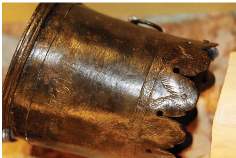
Ieva Bogdanova, Alūksnes muzeja krājuma glabātāja

Alūksnes muzeja ekspozīcijā "Laikmetu mielasts" apskatāmi nesē restaurētie raga taures galu bronzas apkalumi – apakšējais, kas ir iemutes daļa un augšējais - atvere.