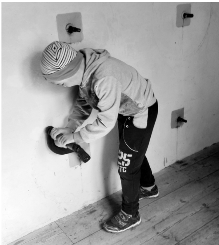
Skolēniem bija iespēja pagriezt cilindrus, lai čiekuri vienmērīgi kaltētos