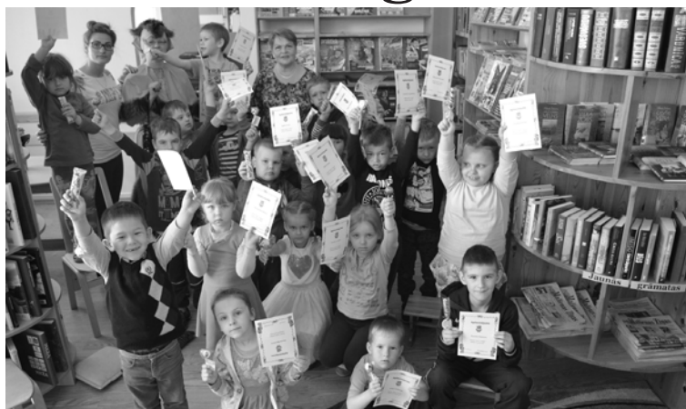
Sadarbojoties PII “Pūcīte” un Kolberģa bibliotēkai, aug jauni grāmatu mīļotāji