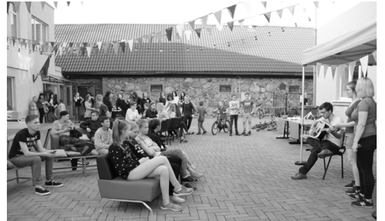
Jauniešu diena “PAGALMA svētki” pulcēja daudz dalībnieku