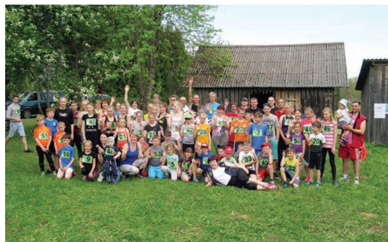
Zeltiņu pagasta atklātā krosa skriešanas seriāla "Mizojam, ka prieks!" 1. kārtas dalībnieku kuplais pulks

Skolēniem paredzētas trīs nometnes par veselīgu dzīvesveidu. Viena no tām plānota jūlijā un būs saistīta ar dažādām fiziskām aktivitātēm. Otrā nometne notiks augustā un tā būs